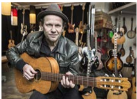
Bo Sundström, känd från Bo Kaspers Orkester.