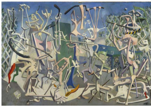
Coups de bâtons, av Mayo.