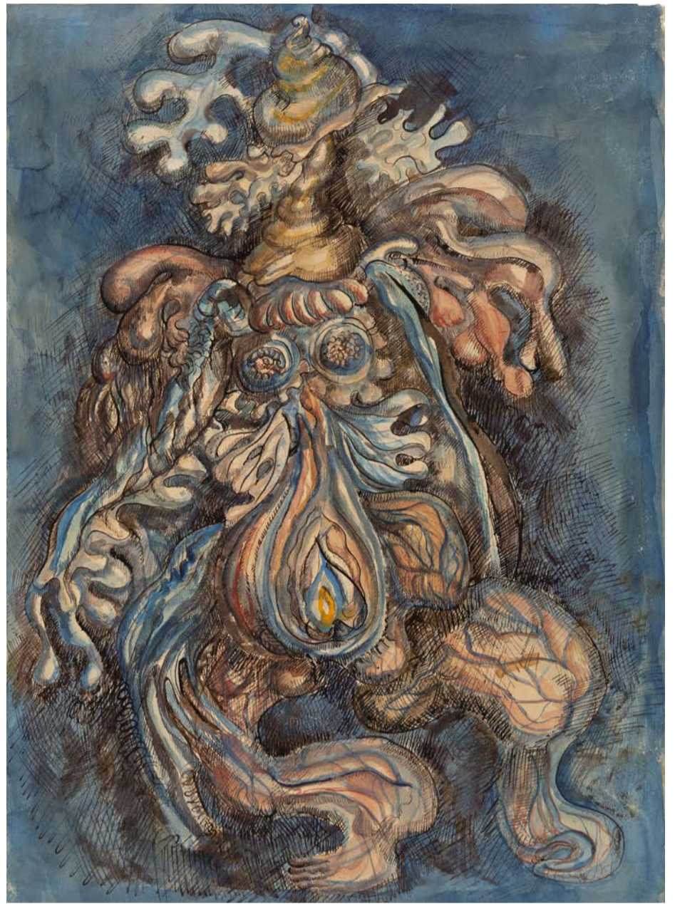
Untitled (Anatomical Corpse) av Amy Nimr.