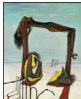
Ramsès Younane, "Utan titel" från 1939.