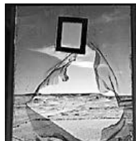
Lee Miller, "Portrait of space", 1944.