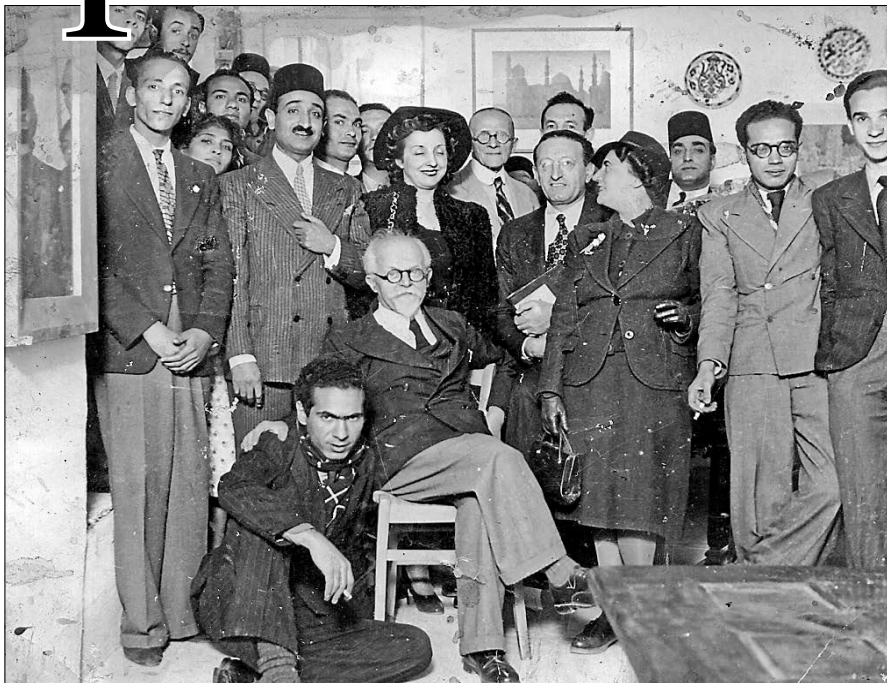
GRUPPEN. Medlemmar och vänner till Art et liberté-gruppen samlade i Konsthuset i Darb el-Labbana, ca 1945. Bilden är beskuren.

Precis som i Parisgruppen samarbetade konstnärerna och författarna i olika bokprojekt: en central gestalt var poeten Georges Henein som drev förlag och gav ut en serie utsökta volymer av bland andra Edmond Jabès och översätt-